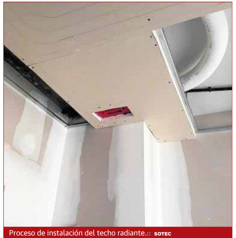
Proceso de instalación del techo radiante.

Muchas gracias a todos por su participación en esta entrevista, y ya saben, cualquier duda sobre este innovador sistema la pueden aclarar llamando a SOTEC, al 958 46 68 23, ellos le asesorarán sobre la climatización de su hogar o negocio y le pondrán en contacto con el instalador más cercano para que se lo presupueste.