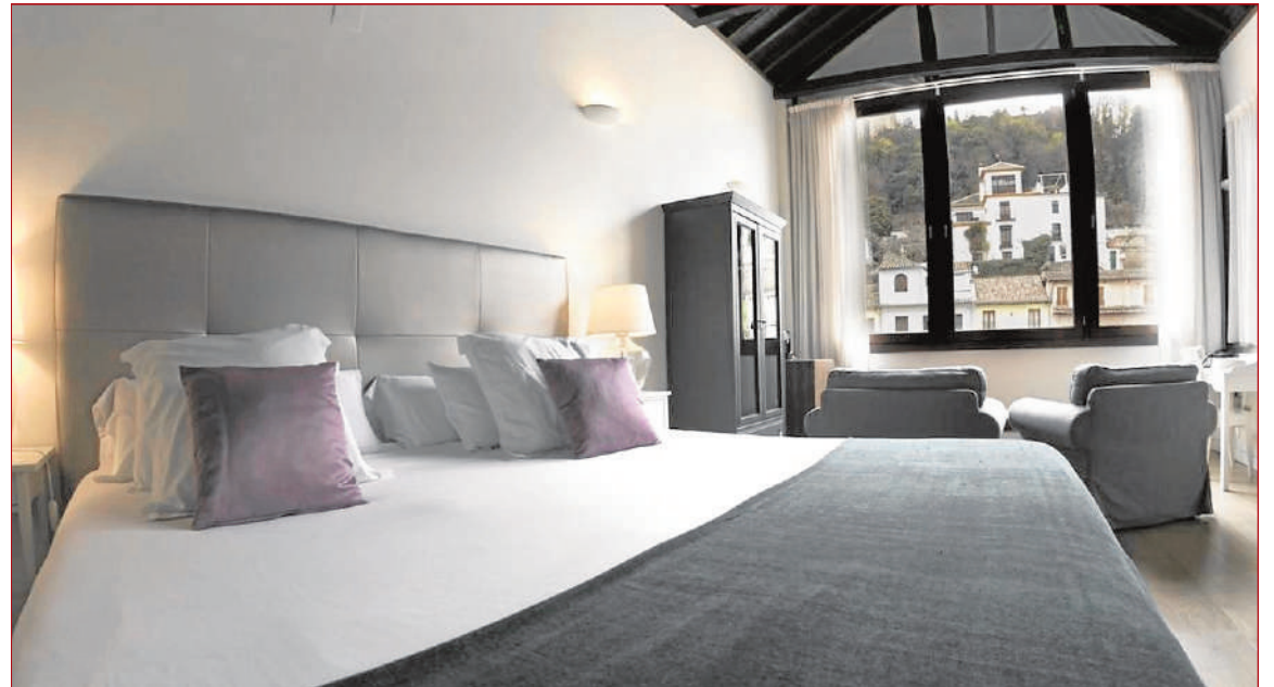
Los clientes disfrutan de una cómoda estancia en pleno barrio del Albaicín. SOTEC

–Ha sido muy interesante realizar la primera instalación de equipos instantáneos de producción de ACS a gas de condensación para un hotel de Granada, en primer lugar porque siempre se ha pensado que lo mejor era disponer de una acumulación de agua que per-