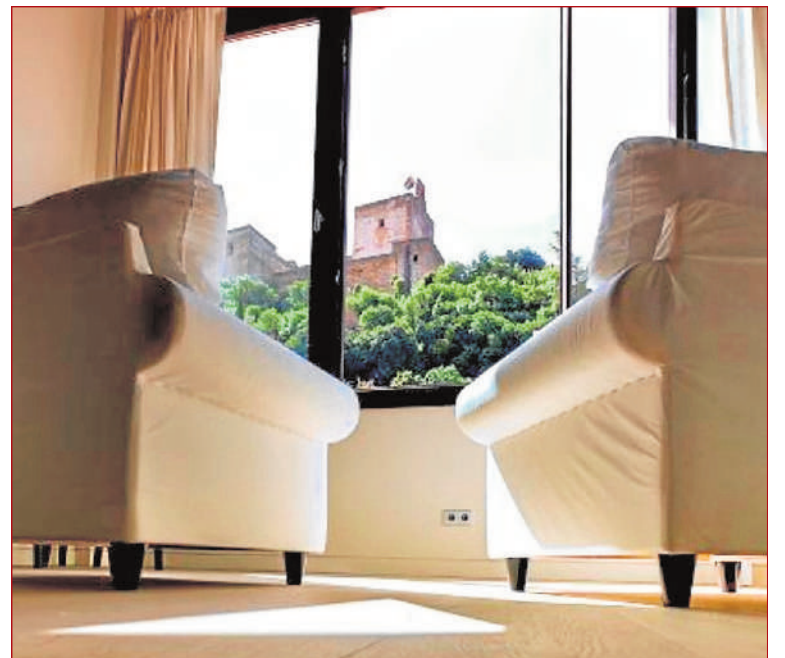
El hotel ofrece unas bellas vistas a la Alhambra. SOTEC

mitiera reaccionar a los grandes consumos que se dan en un hotel, y en cambio ver modular estos equipos de manera que pueden suministrar desde 90 a 1.920 litros de ACS de manera instantánea y sin que el usuario perciba nada es impresionante. El fabricante Japonés Rinnai ha pensado en todo y la experiencia de casi 100 años de la marca se nota en un producto perfectamente desarrollado. En cuanto a la facilidad de instalación es sin duda una gran ventaja porque en un hotel en el Albayzin introducir grandes depósitos de agua caliente con una grúa habría sido muy difícil, con este sistema una sola persona puede llevar cada equipo a su ubicación en la obra, reduciendo tiempos y costos de instalación. El resultado es un gran ahorro en consumo de gas, una inversión menor y mucho menos espacio ocupado. Desde Mi3 estamos muy contentos con esta experiencia y le estamos proponiendo soluciones similares a nuestros clientes en industrias, centros deportivos, centros sanitarios, incluso lavanderías, donde los ahorros generados, la mayor seguridad de suministro y la eliminación de riesgos de Legionella son muy valorados.